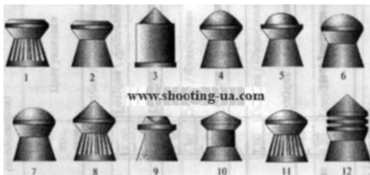
Рис. 17. Пули компании Haendler & Natermann Sport GmbH: www.shooting-ua.com

1 — спортивная пуля типа Match, немецкая модель, рифленая (H&N Diabolo Wettkampfkugeln, deutsches Modell); 2 —