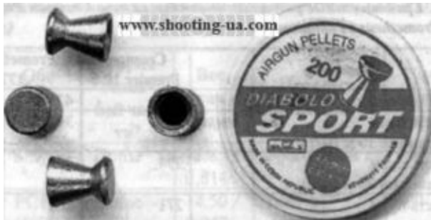
Рис. 21. Пуля Diabolo Sport компании Kovohute (Чехия)

Пули типа Diabolo с округлой головной частью (Domed, Round). Выпускаются в калибрах .177 (4,5 мм) и .22 (5,5 мм). Масса соответственно 0,551 г (8.5 фан) и 0,875 г (13.5 фан). Упаковка с этикеткой бледно-голубого цвета.