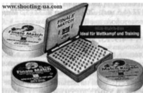
Рис. 15. Упаковка и фирменный бокс для матчевых пуль компании Haendler & Natermann Sport GmbH:

Остроконечные гладкие пули типа Diabolo с тремя ведущими поясками (см. Veeman Silver Arrow). Самые тяжелые пули, производимые компанией H&N. Предназначены для высокоскоростных и мощных ружей. Выпускаются в калибрах .177 (4,5 мм), .20 (5,0 мм), .22 (5,5 мм) и .25 (6,35 мм) с этикеткой голубого / фиолетового цвета.