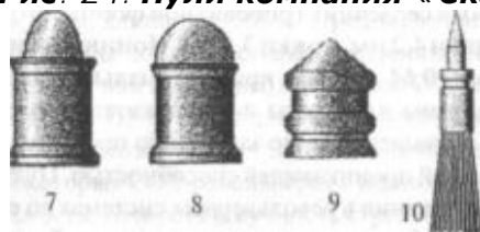
Рис. 24. Пули компания «Скарабей» (Украина): 1 — колпачковая DS-диаболо DS—0,50g; 4 — диаболо DS—0, комбинированная MS-0,57g (Magnum S специальная длинная пуля; S — комби утяжеленная пуля; 9 — эластичная пул

Позиционирована для развлекательной стрельбы из спортивной пневматики и, по заявлению производителя, обладает повышенной проникающей способностью. Пули непригодны для использования в револьверных системах со стандартными (до 7 мм) барабанами, для этого есть другая, 7 мм, модификация этой пули. Упаковка - 50 пуль в жестком пластиковом блистере-корытце, прикрепленном скрепками по углам к картонной крышке с маркировкой.