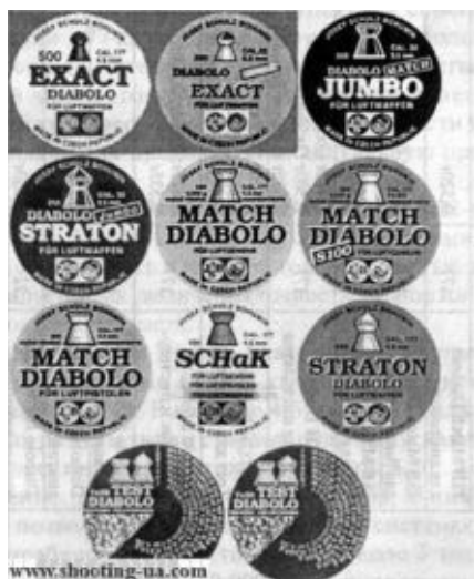
Рис. 19. Пули компании Josef Schulz Bohumin (JSB)

Круглые пули, плакированные медью или без покрытия. Стандартный ассортимент пуль компании имеет диаметры 4,30, 4,35, 4,40, 4,45, 4,50 и 4,55 мм (№№ 7-12). Для № 12 (4,55 мм) предлагаются отдельные серии с диаметрами 4,52, 4,54 и 4,56 мм.