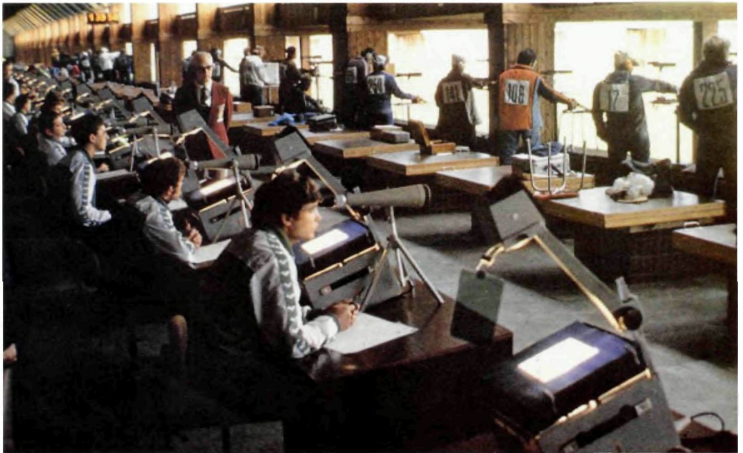
Champ de tir "Dynamo"