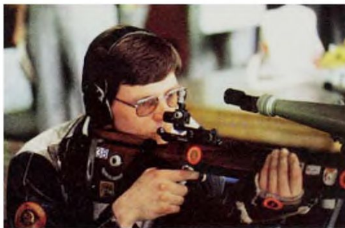
Ligne de feu At the firing line